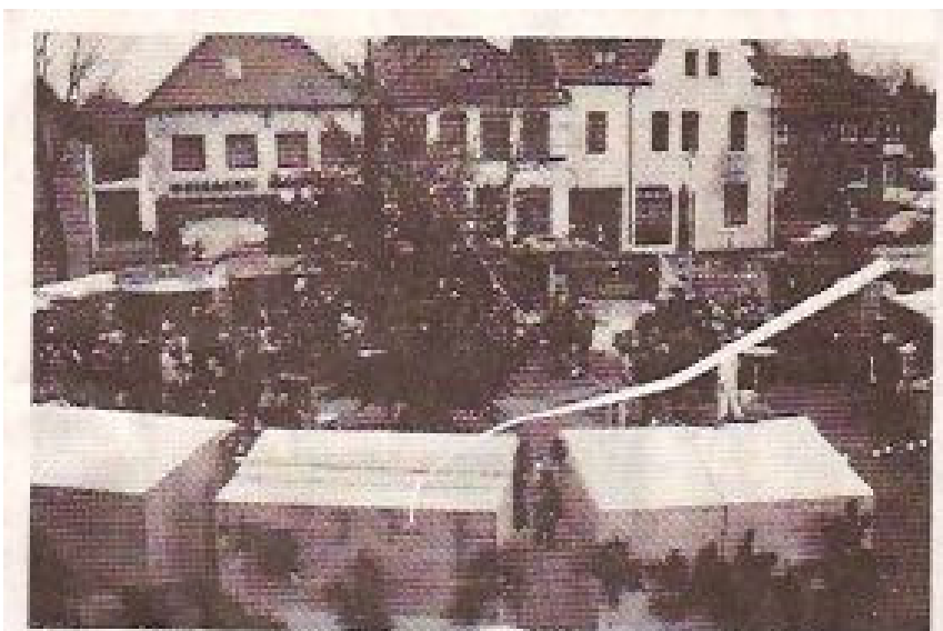
Zum ersten Mal fand auch in Kapellen auf dem Markt ein Weihnachtsmarkt statt, der vom Tennissclub Kapellen veranstaltet wurde.