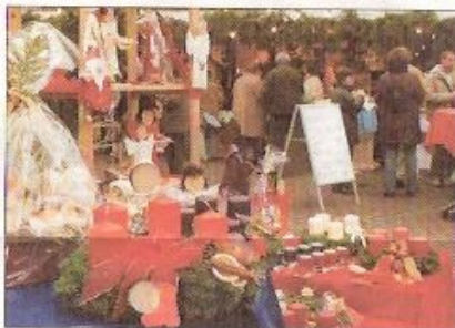
Adventskränze, Gestecke, Baumschmuck und vieles mehr - hier kommt jeder auf seine Kosten.

Der Kapellener Marktplatz wird wieder von weihnachtlich geschmückten Holzhäuschen eingeschlossen, die für alle Besucher besondere Schlemmereien, Gebasteltes, Gestecke und Deko-Artikel darbieten. Vorstand und Vereinsausschuss des TC-Kapellen hoffen auf zahlreiche Besucher nicht nur aus Kapellen, sondern auch aus den umliegenden Städten und Ge-