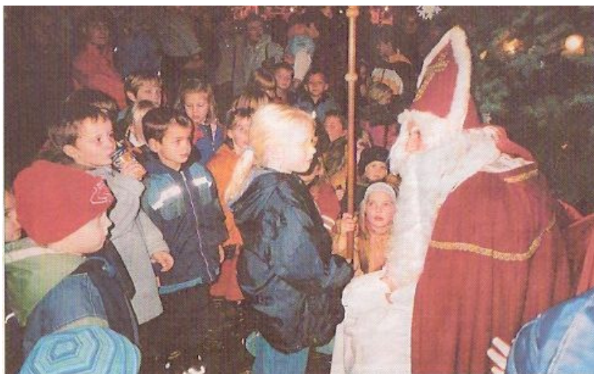
Die Kinder können dem Nikolaus auf dem Kapellener Weihnachtsmarkt einen Besuch abstatten.

Dazu singen die Bewohner von St. Bernadine. Gegen 18 Uhr wird der 10. Kapellener Weihnachtsmarkt dann ausklingen.